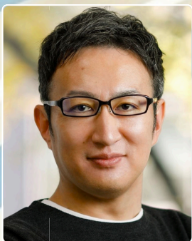
福岡地域戦略推進協議会 事務局長